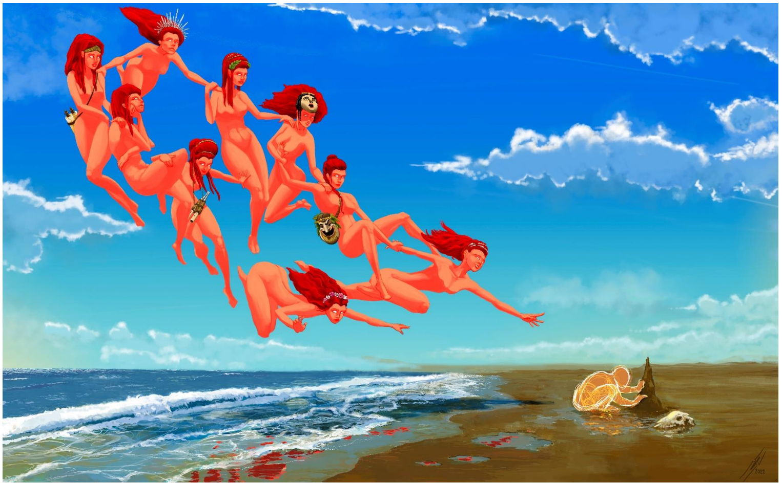
Analema Bucólica. La luz de las Musas (2022), Javier Moreno Martín.