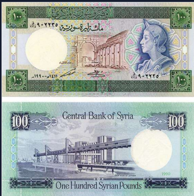
Un billete de 100 libras sirias con la efigie de la reina.