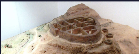
Tin Hinanen hilobiaren maketa (Bardo Museoa, Algeria)

Kontakizun mitikoei jarraituz, Tin Hinan zenbait tuareg tribuetako amalehena izan zen. Ibn Khaldun, XIV. mendeko historialariak, Tiksi izeneko erreginaren inguruko kondaira helarazten du, aurrekoaren oso antzekoa. Bertsio batzuei jarraituz, Tin Hinan musulmandarra zen; beste batzuen aburuz, XVII. mendearen aldera bizi izandako pertsonaia historiko batean dago inspiratuta. Hala ere, 1925ean indusketa arkeologikoek elezarrek Tin Hinan-ekin lotzen zuten muino batean IV. mendeko hilobiratze monumentala aurkitu zuten, Argeliako Abalessa kokalekuan. Orditik aurrera, aztarnok emakume mitiko honen hilobitzat hartu dira tuaregen artean.