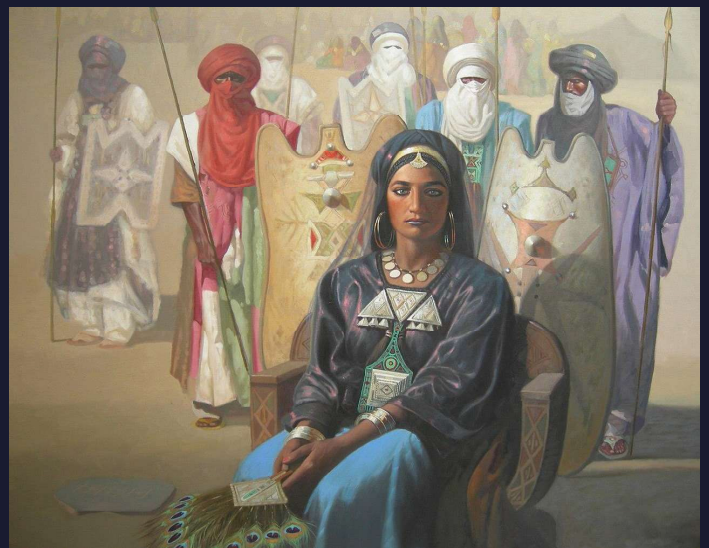
Tin Hinan erregina (Hocine Zianiren margolana)