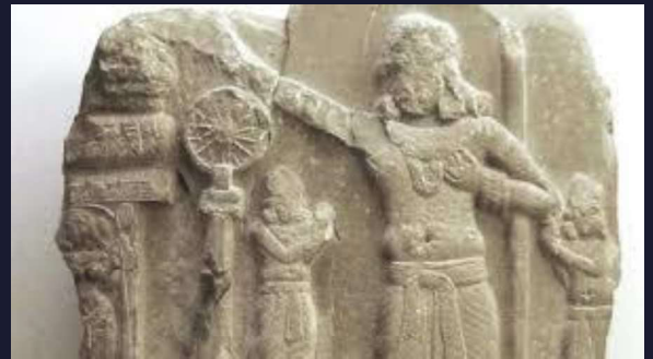
Escultura en relieve procedente de Amaravati. Identificada como una posible representación de Aśoka. Museo Guimet de París. Circa siglo I a.C.