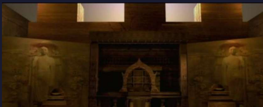
Vihara recreado al inicio de la película Aśoka (2001). Captura de pantalla

En el metraje se incorporaron distintos elementos arquitectónicos y escultóricos que hacían referencia directa a las obras promovidas por Aśoka aunque descontextualizadas, pues la producción filmica se centra en explicar el período previo a la anexión del Reino de Kalinga.