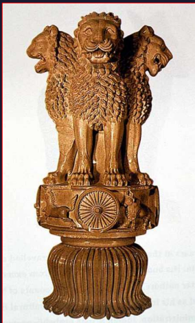
Capitel de Sarnath, erigido por Ashoka hacia el 250 a. C.

Bajo su reinado el Imperio Maurya alcanzó su cénit, llegando a ser uno de los más extensos de todo el oriente antiguo. Con su muerte en el año 232 a. C. se inició el declive de los mauryas.